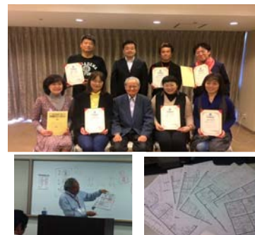
第10期マンダラチャート認定講師セミナー

2泊3日のセミナーで「マンダラチャート」「マンダラ思考」「マンダラ人生計画」「マンダラ手帳」を習得し、それを人に伝えられるようになります！