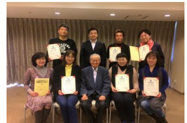
第9期マンダラチャート認定講師セミナー

2泊3日のセミナーで「マンダラチャート」「マンダラ思考」「マンダラ人生計画」「マンダラ手帳」を習得し、それを人に伝えられるようになります！