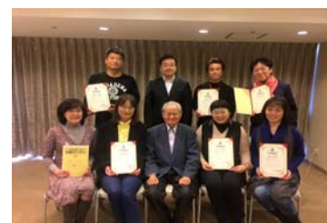
第9期マンダラチャート認定講師セミナー

2泊3日のセミナーで「マンダラチャート」「マンダラ思考」「マンダラ人生計画」「マンダラ手帳」を習得し、それを人に伝えられるようになります！