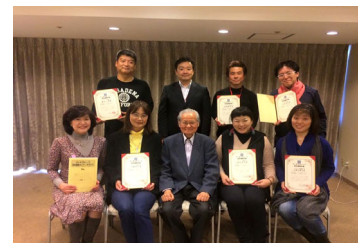
第9期マンダラチャート認定講師セミナー

2泊3日のセミナーで「マンダラチャート」「マンダラ思考」「マンダラ人生計画」「マンダラ手帳」を習得し、それを人に伝えられるようになります！